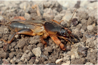
Danaburnu (Çekirgelerden) (Takım: Saltatoria)

Bunlardan daha büyük olan toprak faunası elemanları da (örneğin yılanlar, kertenkeleler, memeliler) megafauna grubuna giriyor.