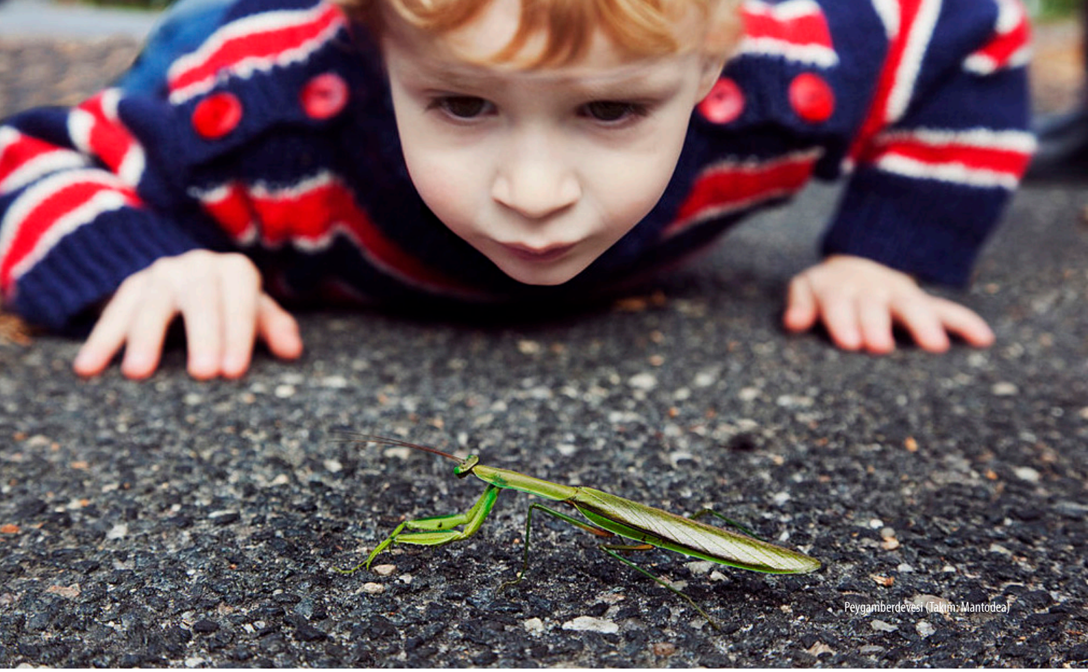
Peygamberbevesi (Takım: Mantodea)

Toprak hayvanları büyüklüklerine göre dört grupta toplanır: