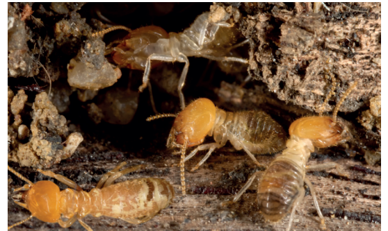
Termit (Takım: Isoptera)

Piknik yaptığımız alanlarda, tarlalarda, evimizin bahçesindeki toprakta acaba hangi hayvanlar yaşıyor?